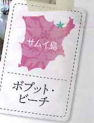
ボプット・ ビーチ

海沿いの「Hビストロ」で 穏やかな水面を眺めて舌鼓 意味するハンサー。沖にパンガン島を望 むボプット・ビーチへ、小道を挟んです ぐに出来るロケーションにある。そんな 好条件と客室の配置から、すべての 部屋がオーシャンビュー。なかには海へ せり出したように間近に感じる部屋も。 チーク材の床にテラゾの大きなバスタ ブ、地元のテキスタイルなどをナチュラル な建材を使い、無駄のないラインでコン テンポラリーなデザインに仕上げている。 サンセット時には、部屋の大きなパ ルコニーにするか、「チル・ラウンジ」 のデイベッドにするか、夕日を拝む場所 に悩んでしまおう。