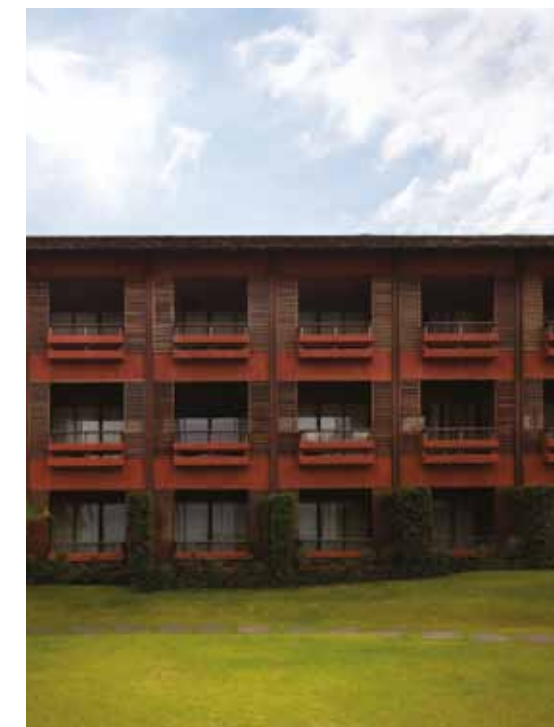
ชาย, ห้องพักถึง 74 ห้อง ของ Hansar Samui จะมีระเบียงกว้าง หันออกสู่ทะเลทุกห้อง แต่ถ้าอยาก ใกล้ชิดกับเสียงคลื่นมากเป็นพิเศษ ห้องเป็นห้อง Beachfront บน, ศิวอาครสีแคงจิวโอบล้อม สนามหญ้าสีเขียวสดและสระว่ายน้ำ

พร้อมโซฟานอนและเก้าอี้โยกสำหรับชิลเป็นการส่วนตัวได้ตลอดเวลา แต่หากอยากใกล้ชิดกับชายหาดและทะเล ก็ต้องเป็นห้องพัก Beachfront ที่มีเพียง 6 ห้องเท่านั้น